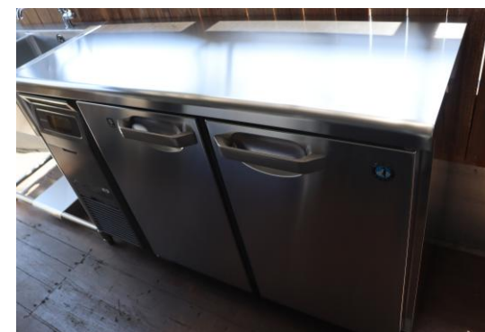
●冷蔵コールドテーブル